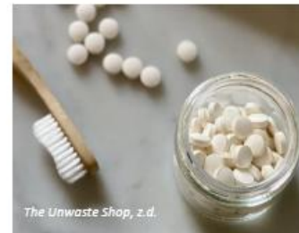
The Unwaste Shop, z.d.