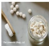
The Unwaste Shop, z.d.